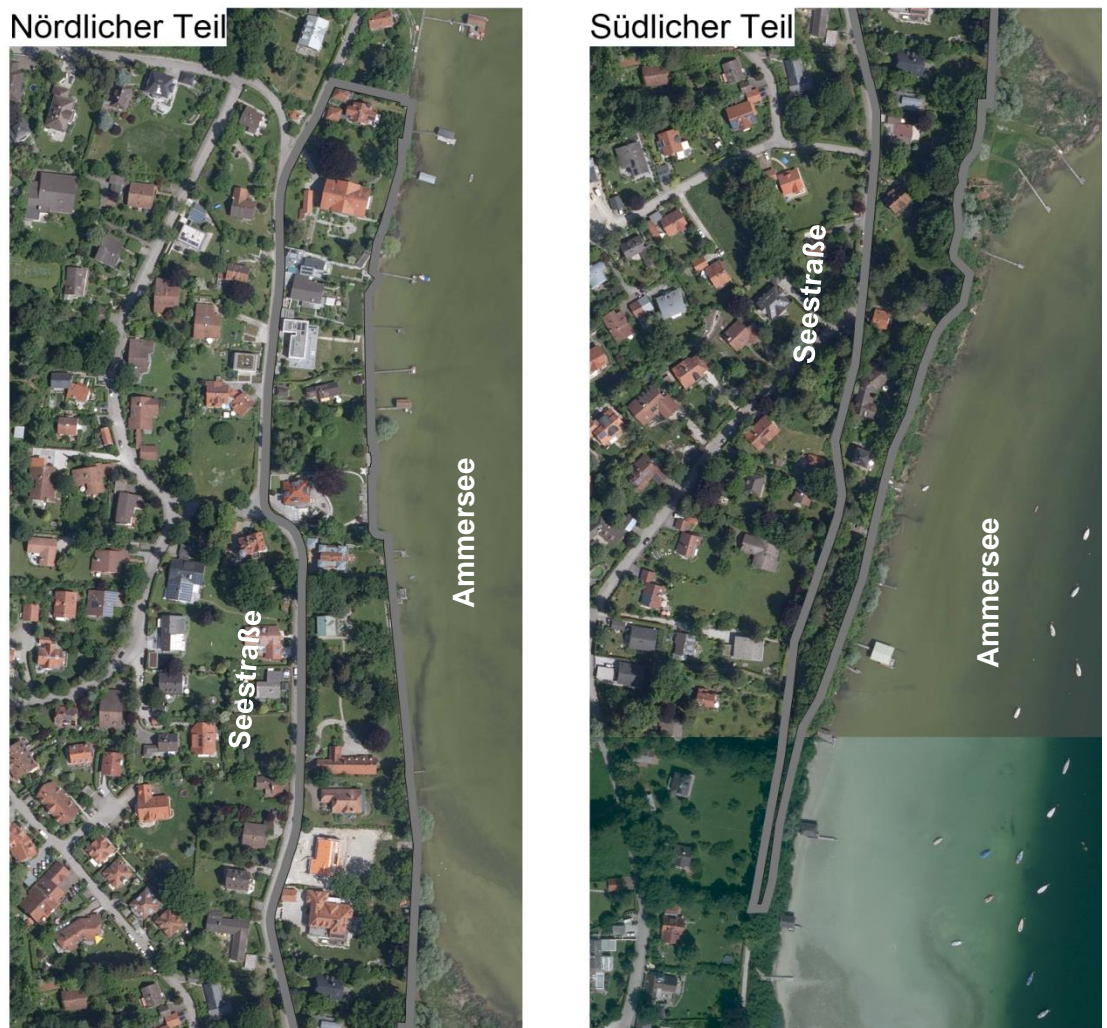
Abb. 2: Luftbild des Plangebiets mit Geltungsbereich

Das Plangebiet liegt im östlichen Bereich des Gemeindegebiets von Schondorf, ca. 650 m (Luftlinie) südöstlich des Bahnhofs Schondorf und östlich der Seestraße. Das Plangebiet hat eine Größe von ca. 43.600 m 2 und erstreckt sich über ca. 1 km entlang des westlichen Ufers des Ammersees, die größte Ost-West-Ausdehnung beträgt lediglich ca. 80 m. Im Norden endet der Bereich mit Beginn des Freizeit- und Erholungsbereichs beim Ortskern von Unterschondorf. Im Süden endet das Plangebiet dort, wo die Seestraße direkt entlang des Ammersees verläuft. Der beplante Bereich ist durch eine lockere Villenbebauung mit einem ausgeprägten Baum- und Gehölzbestand charakterisiert. Von der Seestraße sind zahlreiche prägende Blickbeziehungen zum Ammersee vorhanden, teilweise werden Blickbeziehungen durch vorhandene Gehölze und Hecken beeinträchtigt bzw. sind dadurch nicht mehr vorhanden. Die Topographie des Gebiets weist aufgrund der Uferlage des Ammersees eine deutliche Steigung auf – der Wasserspiegel des Ammersees liegt durchschnittlich auf ca. 533 m ü NN, die Seestraße liegt im nördlichen Bereich des Plangebiets bei bis zu 544 m ü NN und liegt im südlichen Bereich bei 536 m ü NN, daraus ergeben sich deutliche und variierende Neigungen des Geländes.