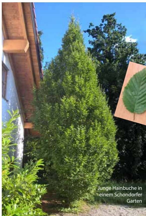
Junge Hainbuche in einem Schondorfer Garten

häufig krumm, hat eine glatte Rinde, einen unregelmäßigen Querschnitt mit schwer erkennbaren Jahresringen und bildet oft mehrere lange Schäfte aus. Das Holz ist sehr hart, härter sogar als Eichenholz, und daher schwer zu bearbeiten. Die Zweige der jungen Bäume wachsen senkrecht nach oben, später orientieren sie sich, für den Laien unerwartet, weit ausgreifend nach den Seiten und bilden mächtige Kronen. Das sollte man also beim Pflanzen bedenken. Das Blatt ist eiförmig, der Blattrand gesägt. Charakteristisch sind die im spitzen Winkel zur Hauptblattader, untereinander parallel verlaufenden Nebenadern. Im Herbst färbt sich das Laub gelb, fällt ab oder hält sich, inwischen trocken und braun, bis ins Frühjahr hinein an den Zweigen. Hainbuchen sind relativ anspruchslos und lassen sich gut stutzen. Daher werden sie häufig als Hecken eingesetzt. Besonders beliebt waren sie deshalb auch in Barockgärten, etwa in Schleißheim (ein Ausflug zu Schloss und Garten lohnt sich). Nicht nur im Garten, sondern auch in der Umgangssprache hat die Hainbuche ihren festen Platz, nämlich in Form des Adjektivs hanebüchen . Das hieß in der ursprünglichen Bedeutung lediglich aus dem Holz der Hainbuche, später auf den Charakter eines Menschen übertragen so viel wie derb, ungehobelt. Heute bezeichnet es etwas Empörendes, Unglaubliches, Skandalöses. Das Wort hat also im Laufe der Zeit einen erheblichen Bedeutungswandel erlebt.