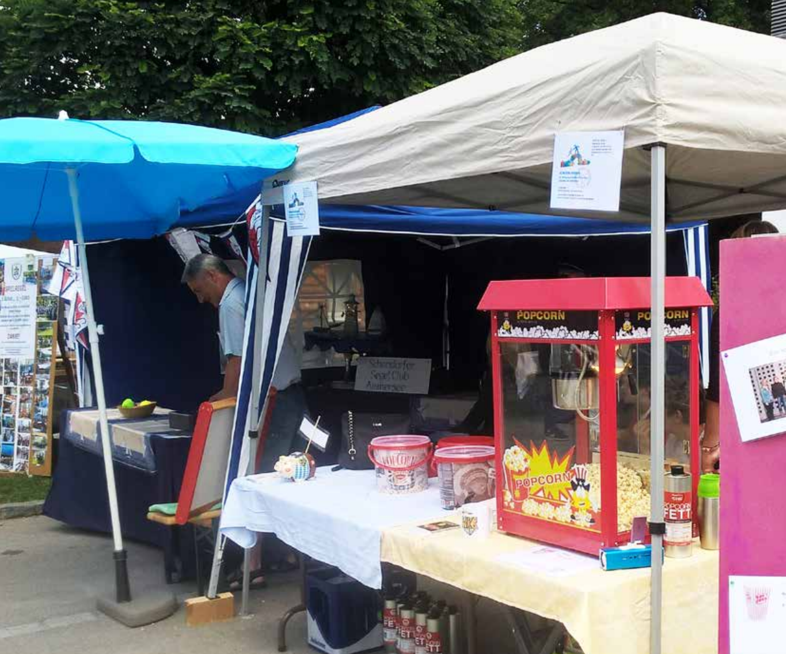
Auf dem Vereine- und Bürgerfest